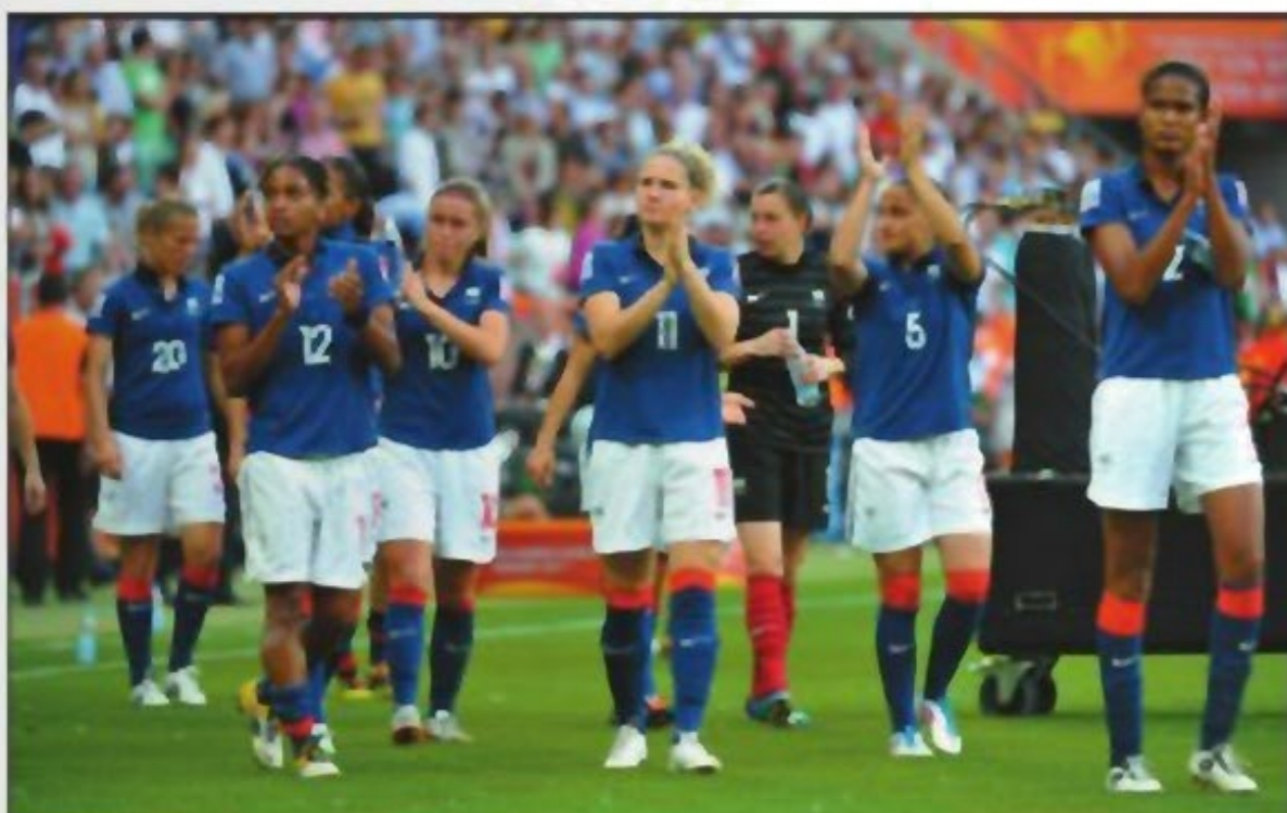
SINSHEIM (Allemagne), RHEIN-NECKAR ARENA, HIER. - Battue par la Suède (2-1) dans le match pour la troisième place, l'équipe de France se projette déjà vers les Jeux Olympiques 2012.