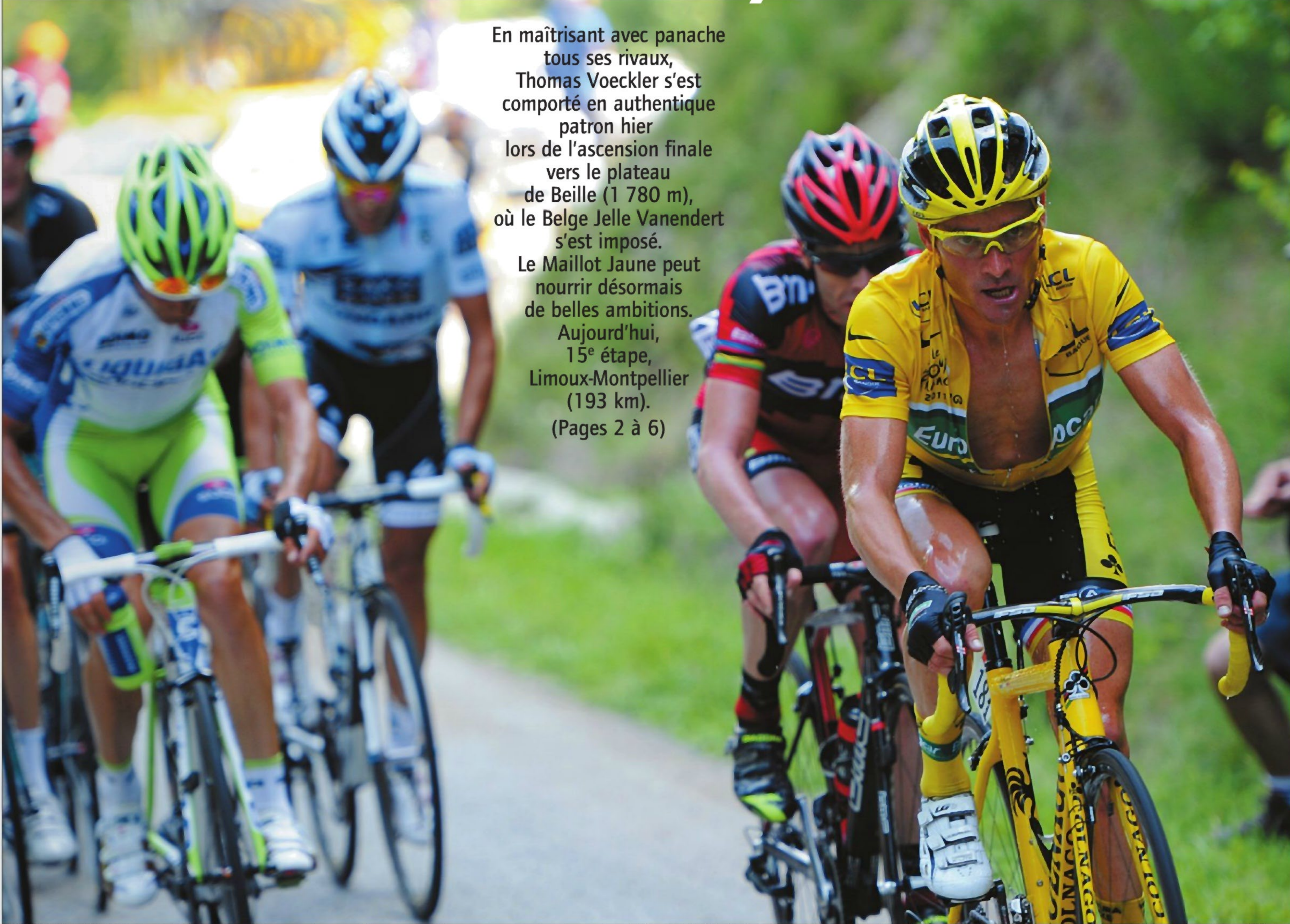
PLATEAU DE BEILLE (Ariège), HIER. - Toujours au premier rang, Thomas Voeckler a encore contenu les aspirants à la victoire finale (ici, de gauche à droite, Ivan Basso, Alberto Contador et Cadel Evans).

En maîtrisant avec panache tous ses rivaux, Thomas Voeckler s'est comporté en authentique patron hier lors de l'ascension finale vers le plateau de Beille (1 780 m), où le Belge Jelle Vanendert s'est imposé. Le Maillot Jaune peut nourrir désormais de belles ambitions. Aujourd'hui, 15 e étape, Limoux-Montpellier (193 km). (Pages 2 à 6)